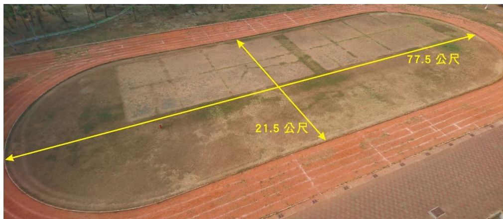
圖一 飛行競賽場地大小示意圖