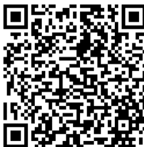
表5、推薦電子書教材

推薦教育部所屬人員(包括一般教師、輔導教師、專業輔導人員，及非教職員工)之電子書教材如表5，電子檔可至下方連結搜尋、使用： https://www.tsos.org.tw/km/4847