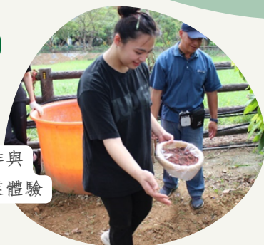
部落咖啡與 紅藜產業體驗