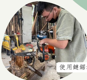
使用鏈鋸進行雕刻