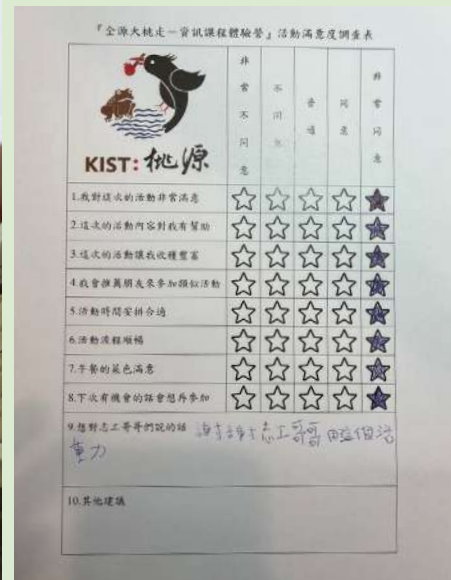
▲ 古文偉小朋友留下了對大哥哥們的感動