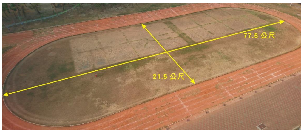
圖一 飛行競賽場地大小示意圖