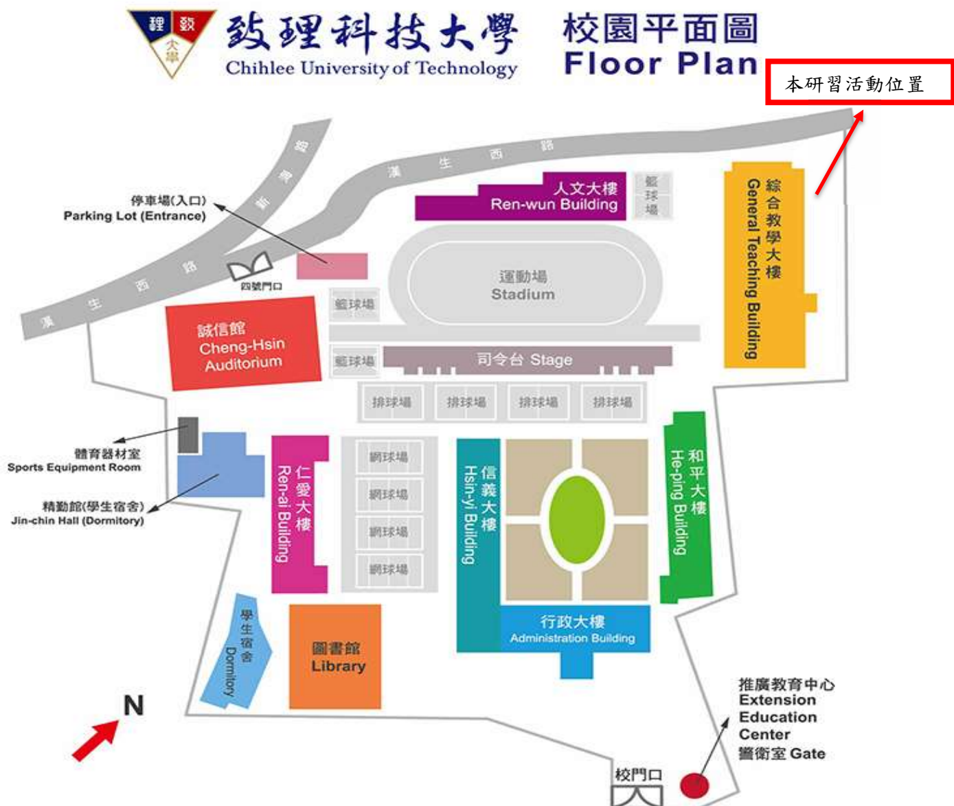
致理科技大學校園平面圖

2.經高速公路國道三號（北二高）中和交流道下，往板橋方向出口，接 64 號快速道路（西向），往萬板路出口方向下橋，直行民生路至迴轉道迴轉往文化路方向，右轉文化路直行，即可到達。