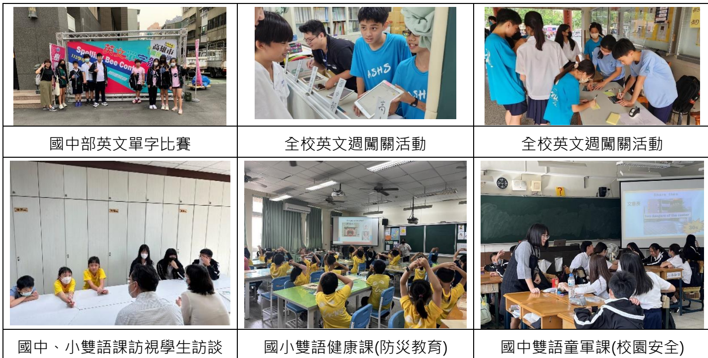
國中部英文單字比賽