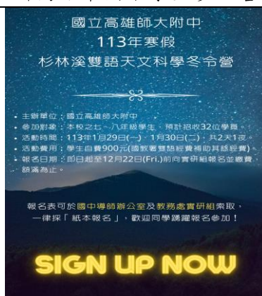
國中部雙語天文寒假冬令營