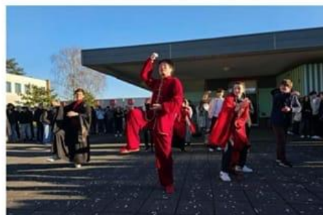
Cet événement était l'occasion de souligner l'intérêt du chinois pour les études, un « atout dans les parcours professionnels ».

Tout savoir sur l'enseignement du chinois au lycée d'Haubourdin : lycee-beaupre.fr/les-specificites/le-chinois .