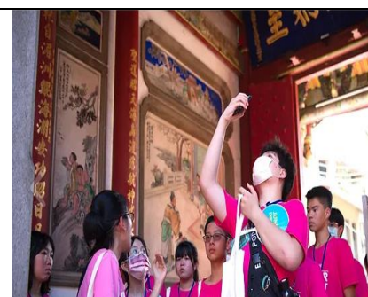
青年外交英文導覽營