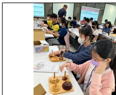
高雄市國中動手玩數學營