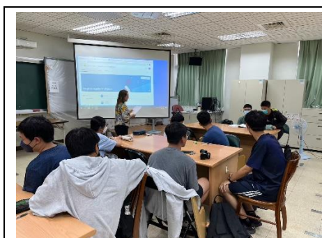
Olha 老師第八節英文班

(6)雙班成果發表會：上學期：辦理數理雙語實驗班第一次期末成果發表會，學生分成雙語生物與雙語科學等學習成果展現，與中山大學教授、長榮大學教授、高師大教授、及高雄女中有初步的交流。下學期預計與他校雙語班進行聯合發表與交流。