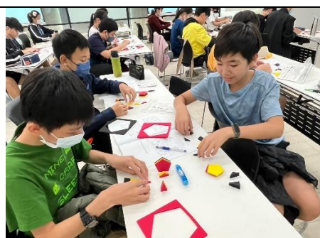
七所高雄市國中學生參加營隊