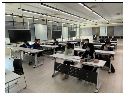
周末假日國中數學獨立研究班