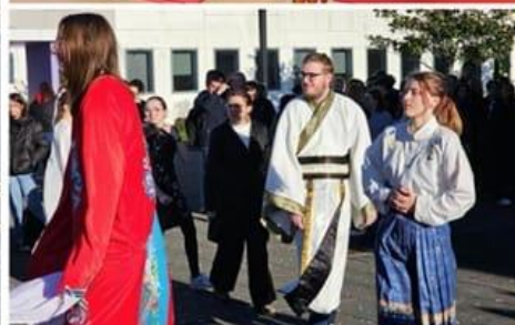
L'après-midi de vendredi a été marqué par des ateliers autour de la culture chinoise dans le lycée Beaupré.