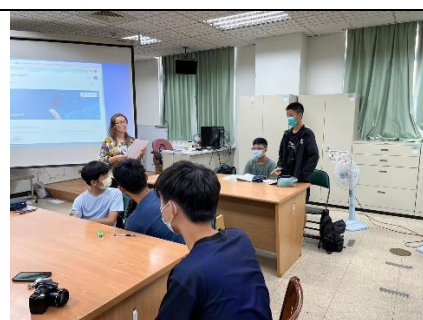
全英閱讀與口說練習