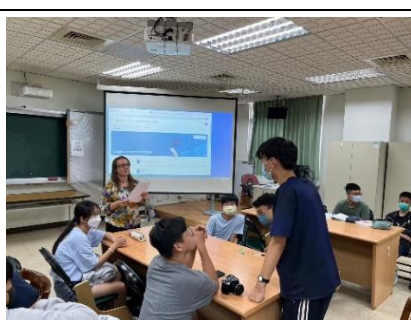
Olha 老師鼓勵學生發表