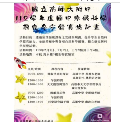
國中部寒假科學探究營