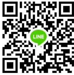
113 學年度 新住民語文競賽 Line 群組

(三)報名隊伍公告：114 年 2 月 26 日（星期三）於本市教育局網站公告報名成功名單，請各校自行查看，不再另行通知，若有遺漏請於 114 年 2 月 27 日（星期四）下午 4 時前，檢具證明向教育局提出。